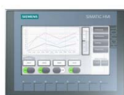
SIMATIC KTP700 Basic Color PN 6AV2123-2GB03-0AX0