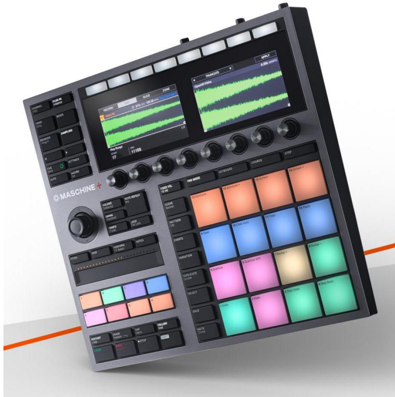
NI MASCHINE 鼓机合成器